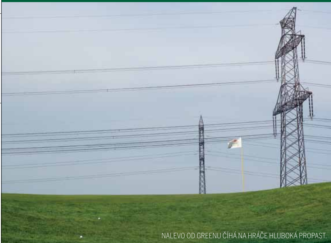
NALEVO OD GREENU ČÍHÁ NA HRÁČE HLUBOKÁ PROPAST.

D vanáctka je překrásným, vzorovým typem strategického designu golfové jamky. Hráč je jednoznačně významně odměněn za odvážný a tvarovaný odpal, namísto hráče, který pokud zvolí konzervativní, bezpečnou cestu a vyhne se nebezpečí ztráty míče ve vodní překážce, je postaven před příhru do greenu naslepo a přes skupinu velmi hlubokých a dramaticky tvarovaných bunkerů. Jamka má pět odpališť v následujících délkách: 359, 330, 296, 259 a 241 metrů. Oba dopadové body, respektive doglegy, jsou až za vodní překážkou. Hráči stojícímu na odpališti se otevírá pohled na celou jamku, její koncept i převážnou většinu překážek. Pohledu dominuje vodní plocha se zajímavě tvarovaným břehem. Jako na dlani vidí, že výhodný odpal musí skončit za vodní překážkou, protože svůj další úder bude hrát do otevřeného approache a greenu. Ideálním odpalem je pak lehké draw po pravém břehu jezera, které v případě, že by nepřišlo, má pořád šanci díky tvarování fairwaye dorolovat do výhodné pozice za vodní překážkou. Naopak pokud hráč zvolí bezpečný odpal po pravé straně jezera na širokou fairway, zahraje svůj míč do části fairway, která je zakončená sérií bunkerů. Bunkery jsou rozmístěny tak, že příhru do greenu v tomto případě musí být