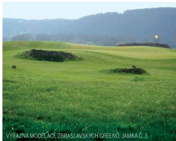
VÝRAZNÁ MODELACE ZBRASLAVSKÝCH GREENŮ, JAMKA Č. 8

Zdařilým vytažením přední části greenu do svahu approache a bohatou modelací samotných greenů, často s více puttovacími úrovněmi, architekt hráči vizuální kontakt umožňuje. Právě tento kontakt na většině vodních jamek je hráči velkou pomocí. Omezení objemu, výšky, tvaru a velikosti terénních úprav v aktivní průtočné zóně, to je oblast, ve které se nacházejí vodní jamky,